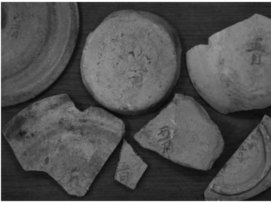
「五月」と書かれた土器／柏原遺跡（南区）・博多遺跡群（博多区）出土

古代から続く太陰太陽暦は明治六（一八七三）年、より精密で都合がよい暦法であるとして太陽暦が採用されるまで、長い間用いられてきました。