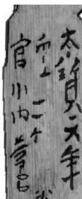
元岡・桑原遺跡群出土の紀年銘木簡 (墨書部分は各報告書の実測図より)

内(西区)の古墳から取り出されたものです。鉄刀に金で象嵌された「大歳庚寅」という文字は、出土状況と合わせて、暦博士がやってきて間もない、西暦五七〇年にあたるのがわかりました。国内で暦が使用された最初期の例となる資料です。