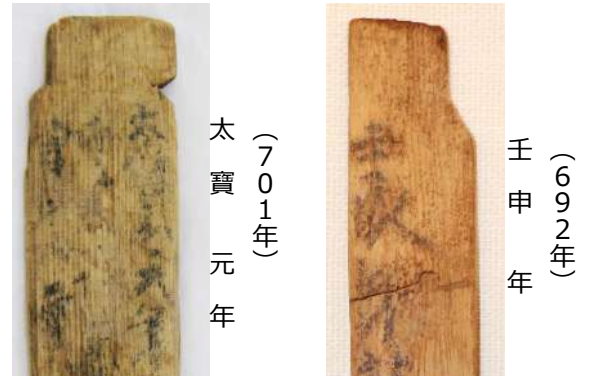
▲（左・右ともに）元岡・桑原遺跡出土の木簡 *「太寶元年」=大宝元年

また、明治時代の太陽暦の採用まで視野に入れた展示は、幅広い時代の資料をあつまっている博物館ならではのものです。