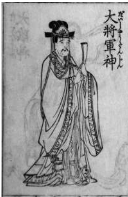
方違は大將軍神ほか方角神がいる方角に向かうことを避けるため行われた。（『立表測景暦日診解』より）

日本の暦を古代から通してみると、私たちが使用する太陽暦は、時の区切り方としてまだ歴史が浅いものですが、カレンダーには、長く人びとの生活に根付き、暦の一部として用いられてきた語句をみることが出来ます。今回、典拠が初めて日本の歌集となった元号もその一つ。ぜひ元号だけでなく色々な言葉にも注目してみてください。（佐藤祐花）