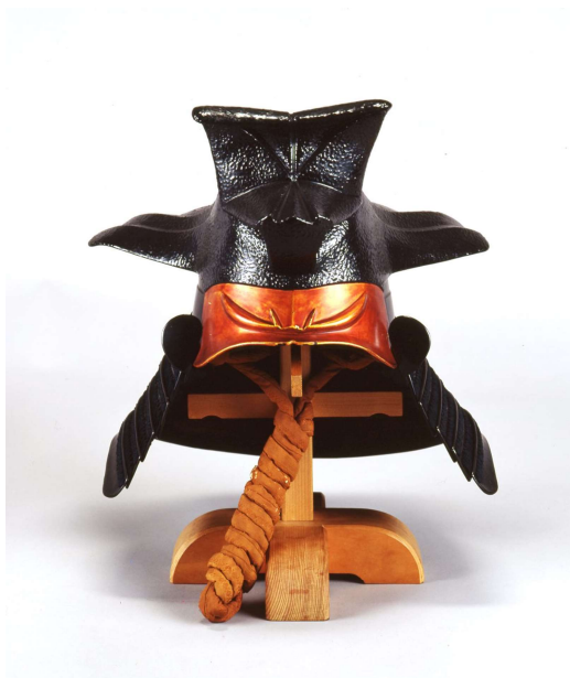
もうすなりかぶと 帽子形兜

過去 5 年間の黒田家名宝展示のなかから、変わり兜や藩主の甲冑、武芸書などをもう一度紹介するほか、コロナ禍で展示が中止になった資料も展示します。約40点。