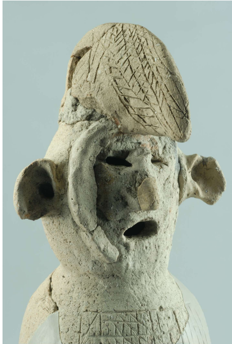
たでもちびとはにわ せいづか 盾持人埴輪（拝塚古墳）