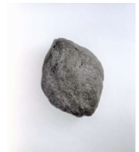
ひえ 桜の種（比恵遺跡群）