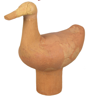
みずとりがたはにわ まるくまやま 水鳥形埴輪（丸隈山古墳）

とぼけた表情や デフォルメされた デザインが魅力！ 福岡市内から 出土した埴輪を 紹介します。約35点。