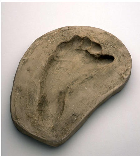
水田の足跡型 いたづけ 水田の足跡型（板付遺跡）

水田における四季の移ろいを題材に、 弥生時代の人びとの心をつつめます。 約75点。