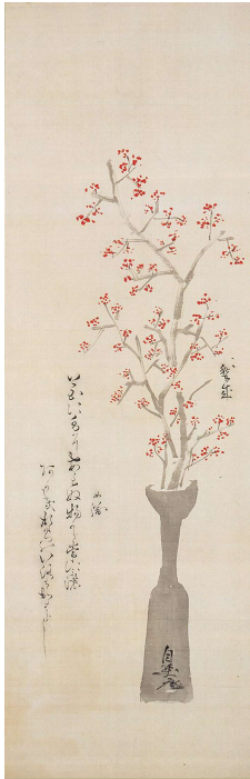
くろだながひる ながともおんよせあわせがき 黒田長溥・長知 寄合書