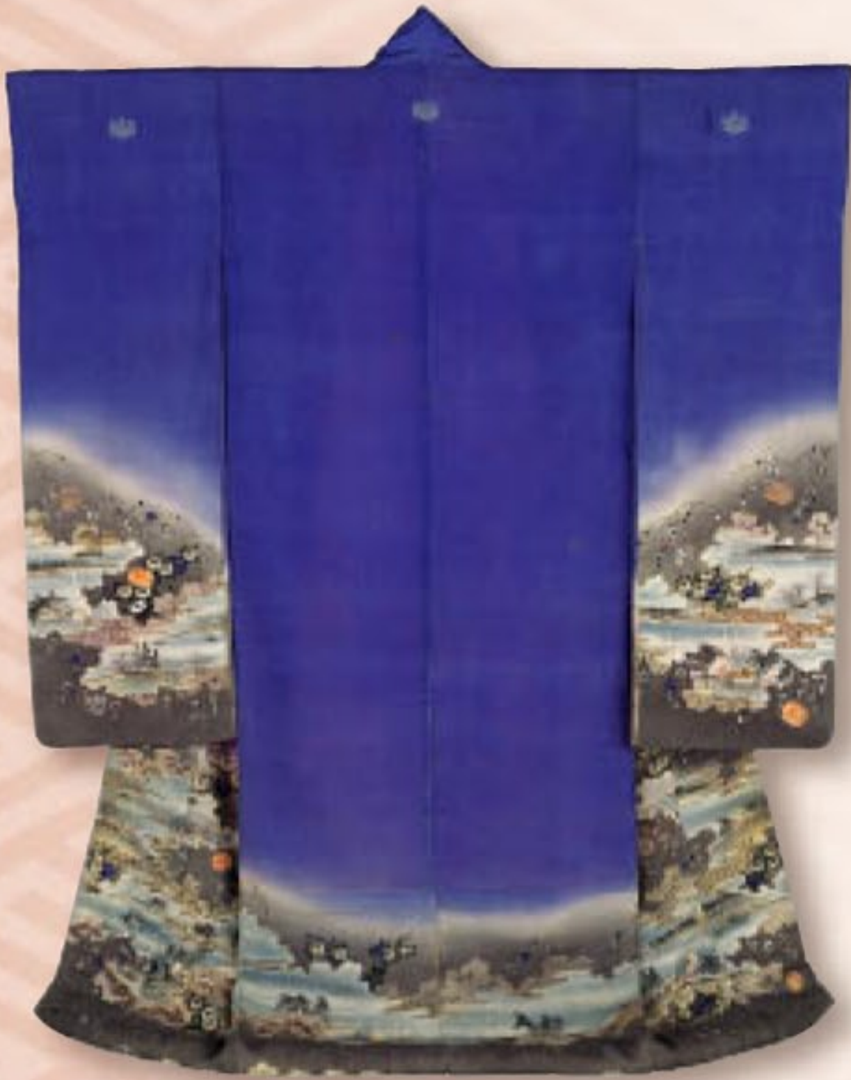
藤紫縮緬地風景模様振袖 明治時代 19~20世紀 個人蔵