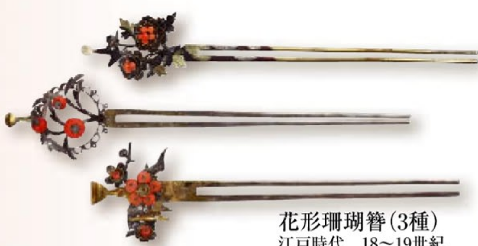
花形珊瑚簪(3種) 江戸時代 18~19世紀 澤乃井櫛かんざし美術館蔵