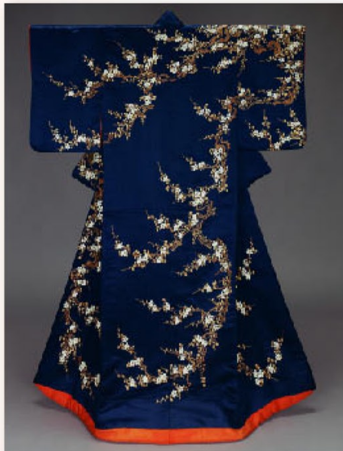
紺緋子地梅樹模様打掛 江戸時代 19世紀 ボストン美術館蔵