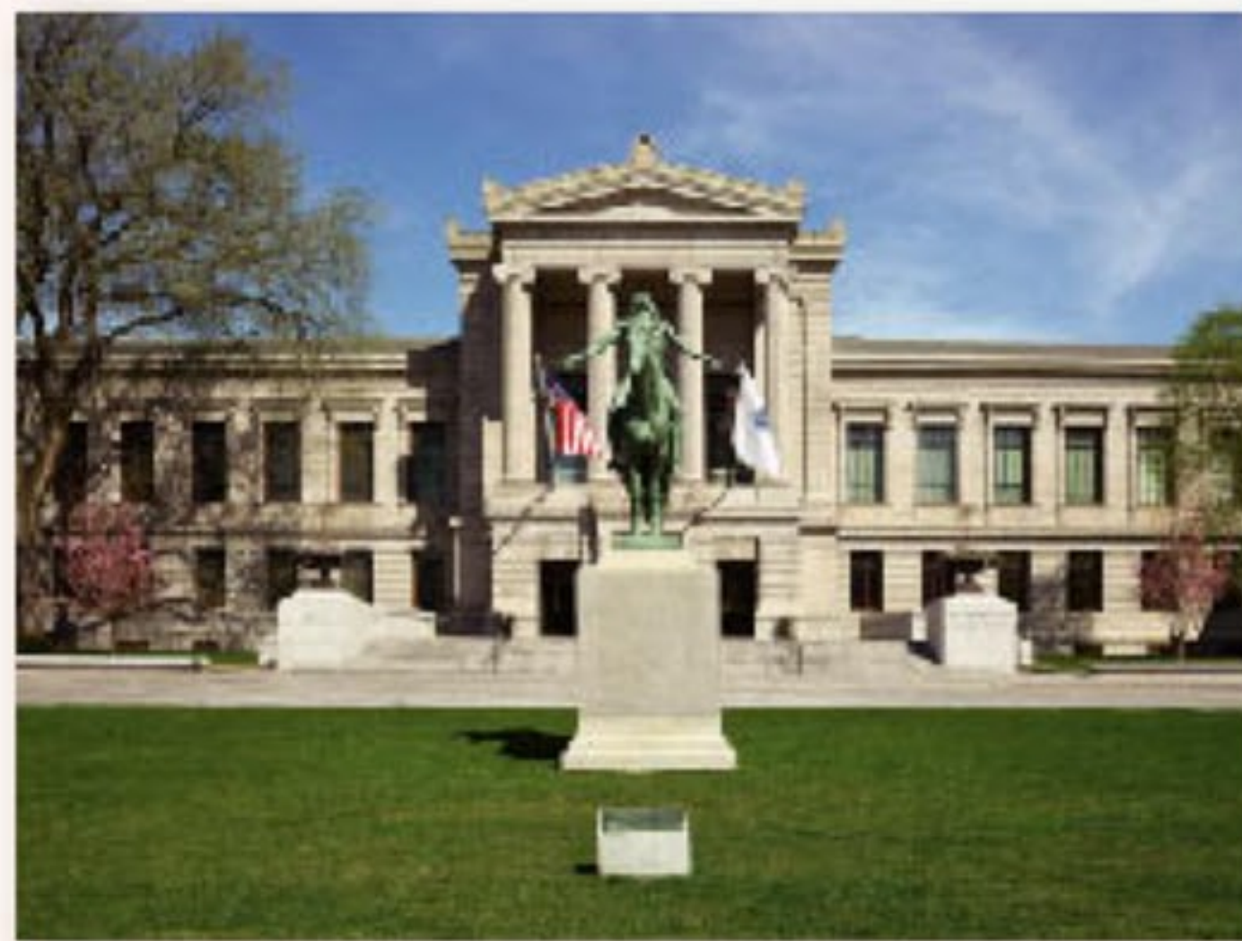
ボストン美術館