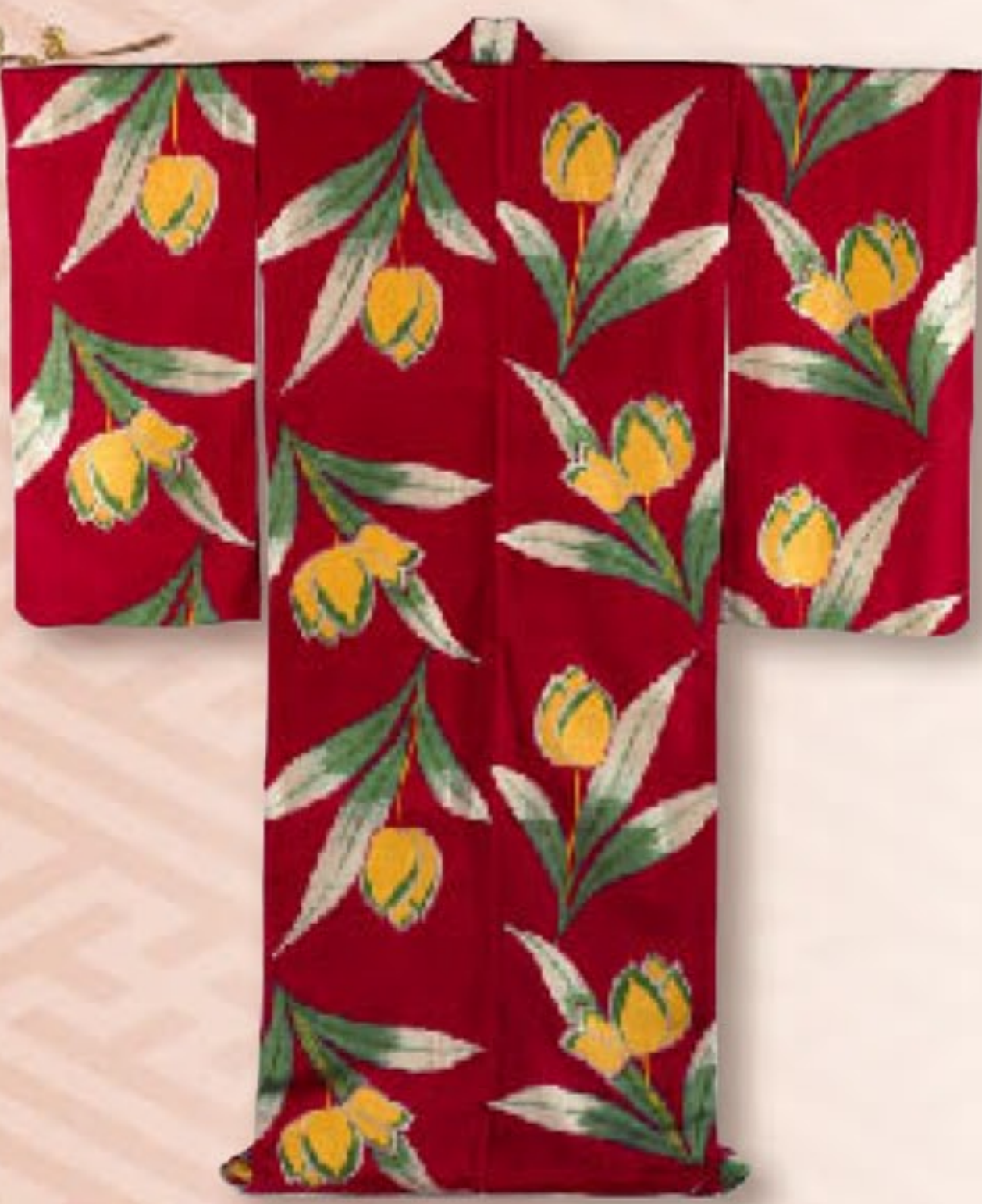
赤地チューリップ模様変わり織銘仙着物 昭和時代 20世紀 須坂クラシック美術館蔵