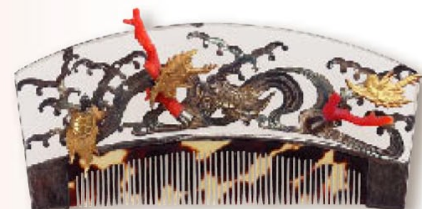
波頭鶴亀模様金銀珊瑚櫛 江戸時代 18~19世紀 澤乃井櫛かんざし美術館蔵