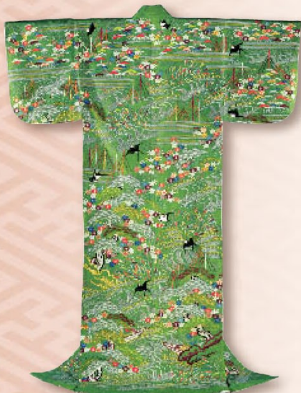
萌黄絹縮地燕網干船模様単衣 江戸時代 18~19世紀 共立女子大学蔵