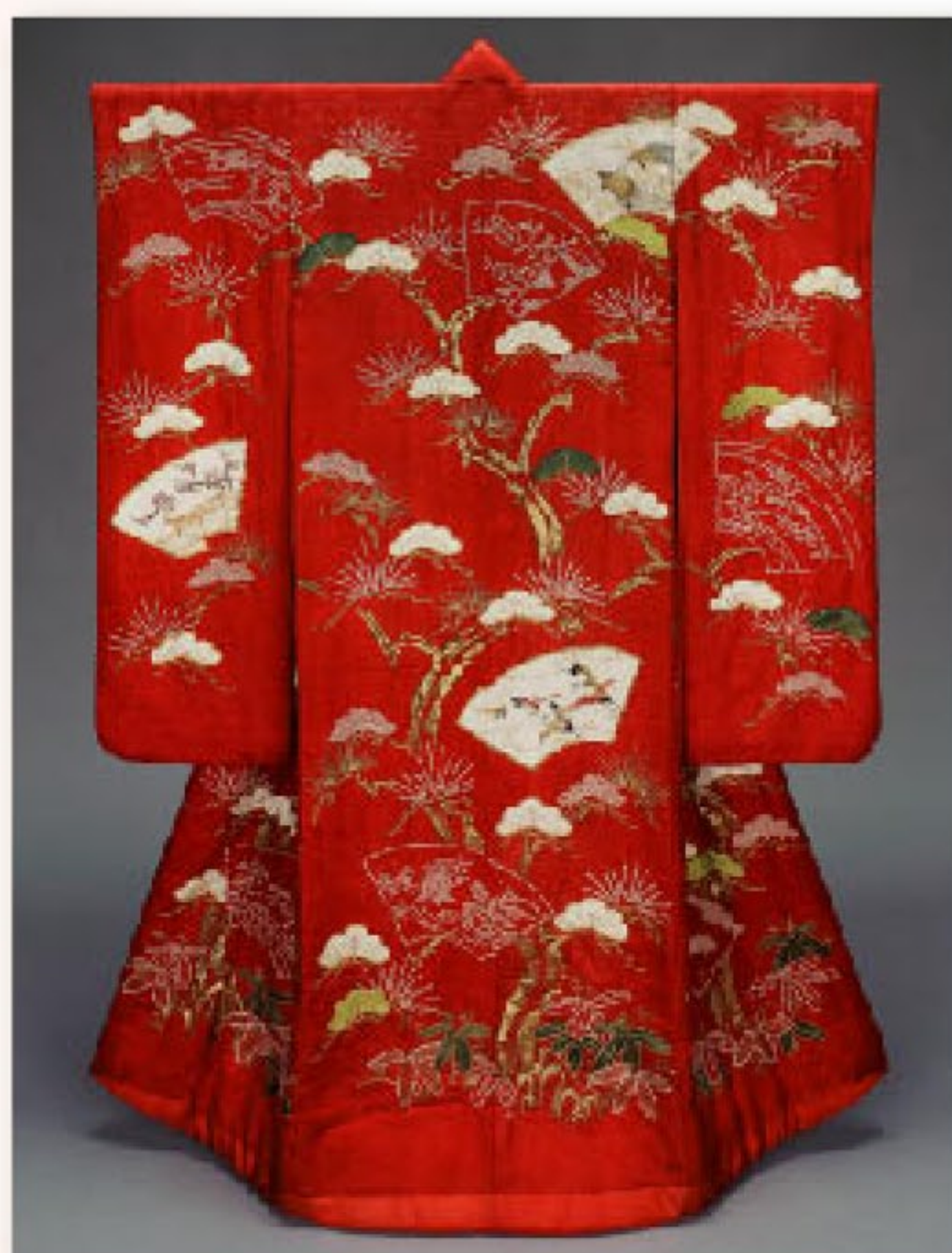
紅綸子地松笹扇地紙模様打掛 江戸時代 18~19世紀 ボストン美術館蔵