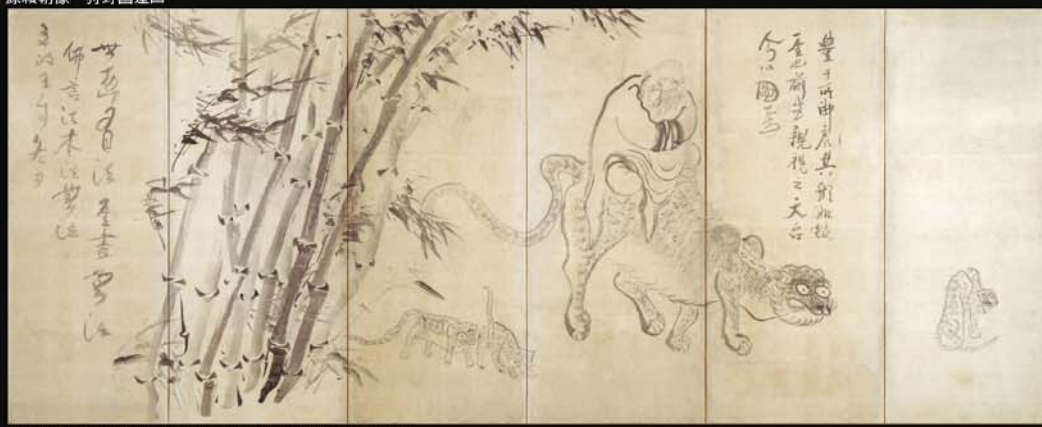
寒山拾得・曇干禪師図屏風(左隻) 僊厓義梵画(幻住庵藏)