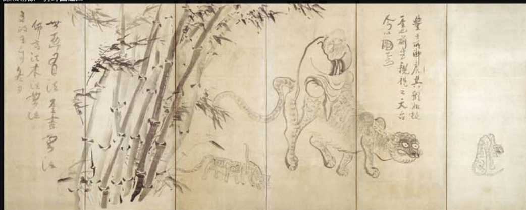
寒山拾得・豊干禪師図屏風(左隻) 僊匡義梵画(幻住庵藏)