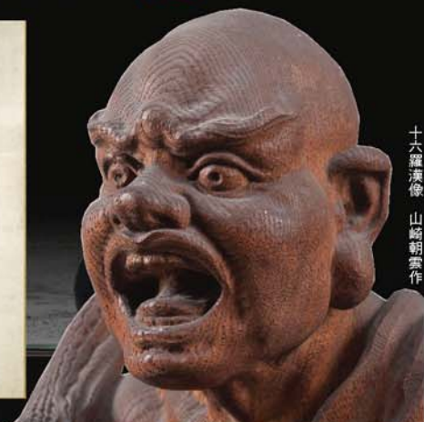
十六羅漢像 山崎朝雲作