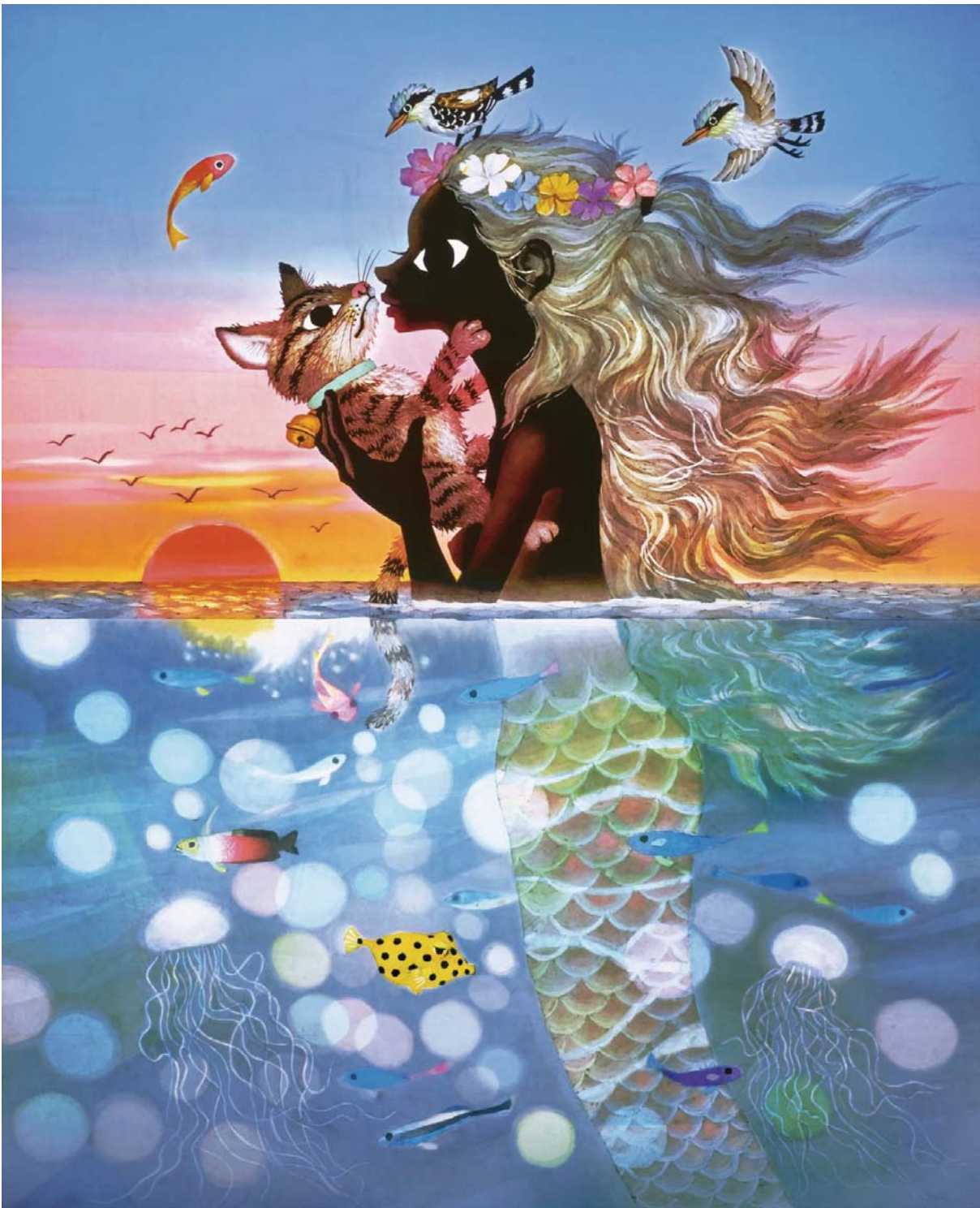
[夕陽の中の愛の奇蹟] 2004年 ©Seiji Fujishiro/HoriPro