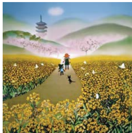
『菜の花の道』1980年

今回はその宮沢賢治の物語をテーマにした作品群を中心に、前回ご覧いただけなかった多くの作品をお届けします。90歳を越えてさらに輝きを増した藤城清治からの「愛の贈りもの」をぜひ福岡市博物館で受け取ってください。