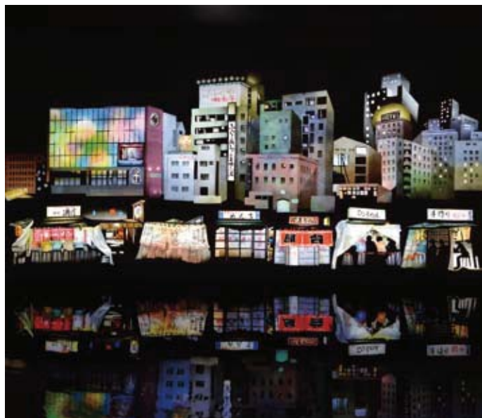
『博多屋台ネオン村_水面』2014年

1924年4月17日東京生まれ。慶應義塾大学経済学部卒業。大学在学中より影絵創作活動を開始。大学卒業後は、人形と影絵の劇団ジュヌ・バントル(のちの木馬座)を結成。編集者花森安治に才能を認められ雑誌『暮らしの手帖』に影絵を連載する。TV番組「木馬座アワー」では、自ら演出、自身が生み出したオリジナルキャラクター「ケロヨン」が爆発的な人気を博した。2013年には栃木県那須高原に藤城清治美術館が開館。日本ユネスコ協会連盟賞、厚生省児童福祉文化奨励賞、文化庁芸術祭優秀賞など多数受賞。また、長年にわたって宮沢賢治の童話を影絵で表現し続けてきた活動が評価され、2014年に「第24回宮沢賢治賞」を受賞した。