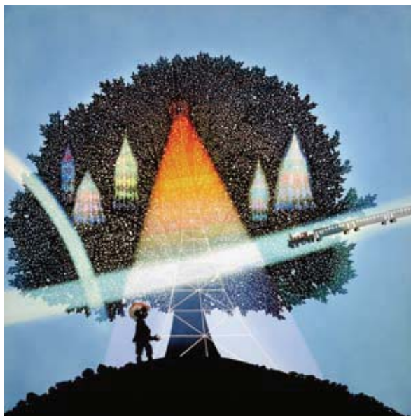
『銀河鉄道の夜 天気輪の木』2010年 ©Seiji Fujishiro/HoriPro