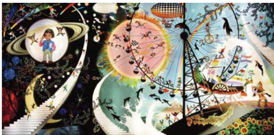
全長6mの大作 [日テレ 24 時間テレビ 小さな奇跡 大きな奇跡] 2014年 ©Seiji Fujishiro/HoriPro