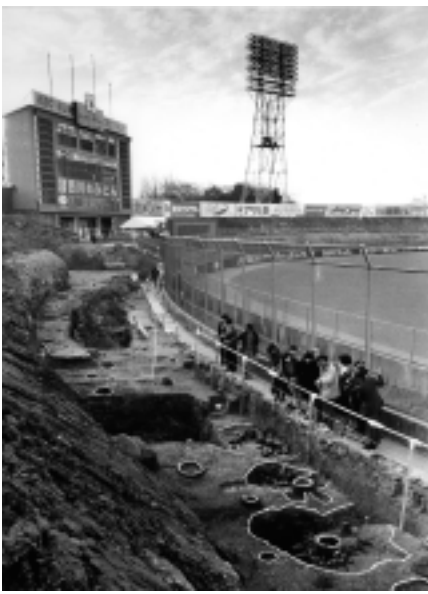
30年前の発掘調査(平和台球場内)

今回の展覧会では鴻臚館跡の発掘調査成果の集大成とともに、ここを行き交った人々と唐物に関連する歴史資料を一堂に紹介します。