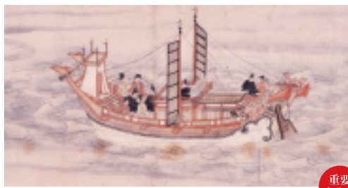
高野大師行状図画「大師御入唐事」 白鶴美術館蔵

※ワークショップの申込方法等イベントの詳細は、福岡市博物館HP等をご確認ください。 http://museum.city.fukuoka.jp ※博多湾岸(金印ロード)は、福岡市博物館がさまざまな機関・人と連携して行うプロジェクトです。文化庁の平成29年度地域核となる美術館・歴史博物館支援事業採択事業です。