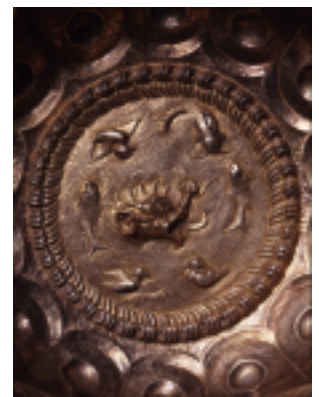
鍍金龍池鴛鴦双鱼文銀洗(部分) 白鶴美術館蔵