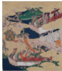
源氏物語絵巻紙帖「胡蝶」 京都国立博物館蔵