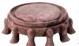
緑釉獣脚硯(藤原京跡出土) 奈良文化財研究所蔵