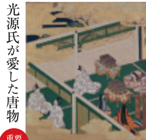
光源氏が愛した唐物 源氏物語絵巻紙帖「絵合」 京都市立博物館蔵