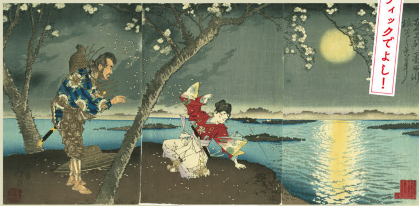
●月岡芳年 東名所盛田川梅若之古事 明治十六年(一八八二)