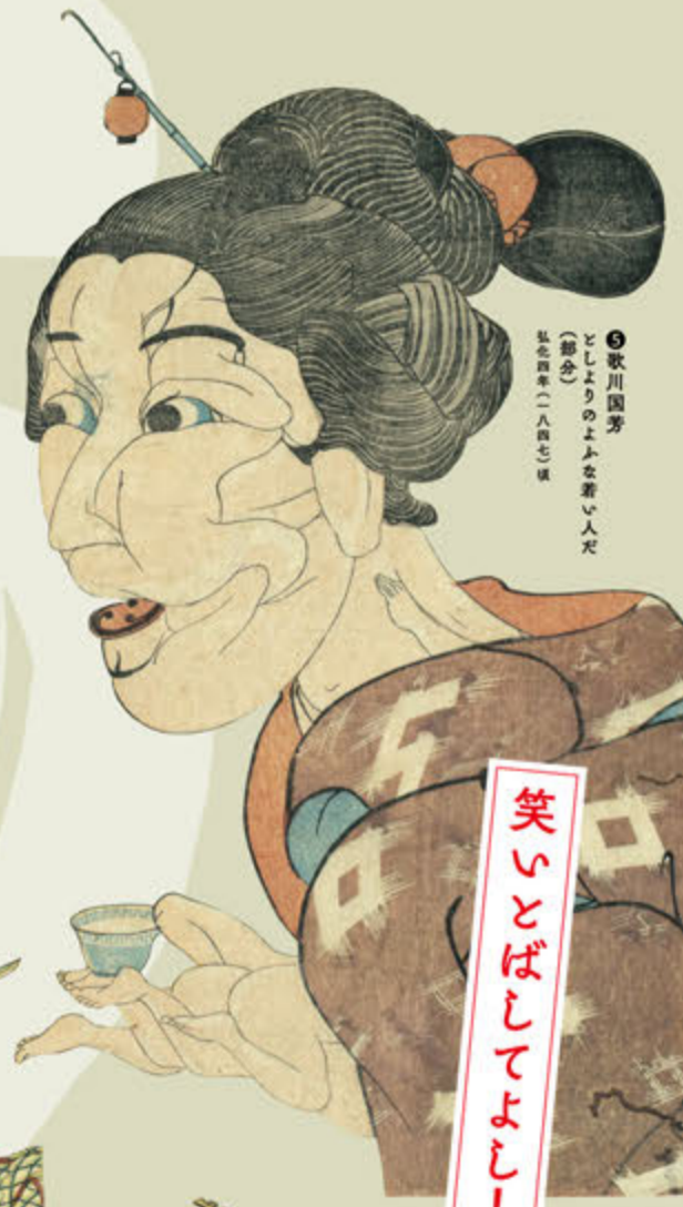
●歌川国芳 としよりのよふなを悪し人だ (部分) 弘化四年(一八四三)頃