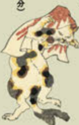
●歌川国芳 日本駄右エ門猫之古事(部分) 弘化四年(一八四七)

歌川国芳(一七九七-一八六二)は、ダイナミックな武者絵やユニークな戯画で、幕末の浮世絵に新機軸を打ち出した「奇想の絵師」です。親分肌の国芳の元には多くの弟子が集い、一門は激動する時代のうねりの中で、つねに新しい画題や表現に挑み続けました。なかでも月岡芳年(一八三九-一九二二)は、浮世絵と西洋画の融合を推し進めた絵師として、近年再び評価が高まっています。 本展では、名古屋市博物館の豊富な浮世絵コレクションから約150点を選り抜き、旺盛な好奇心と柔軟な発想、豊かな表現力によって国芳が切り開いたさまざまな新画面が、どのように弟子たちに継承され、変化していったのかに注目します。なお一部作品には、衝撃的な表現がございます。