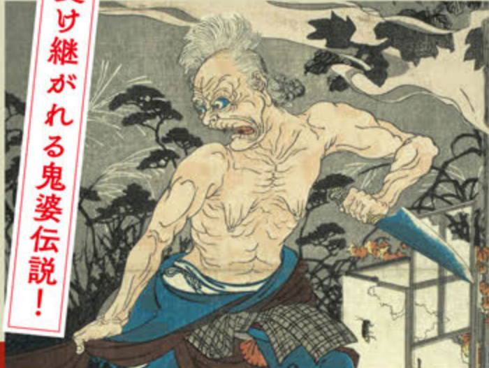
●歌川国芳 観世音霊験(部分) 天保十二年(一八四二)