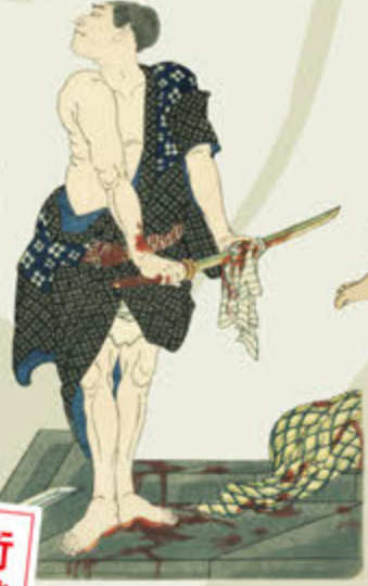
●月岡芳年 英名二十八衆句 因果小僧六之助(部分) 慶応二年(一八六六)

歌舞伎などの刃傷場面ばかりを描く本シリーズは、国芳門下の双璧とされる落合芳幾(一八三三-一九〇四)と月岡芳年が競作したもの。本展では、因縁のライバルが腕を競い、凄惨な描写に目を奪われますが、実は背後のストーリーと、当時の印刷技術の粋を集めた刷りや彫りも見所です。