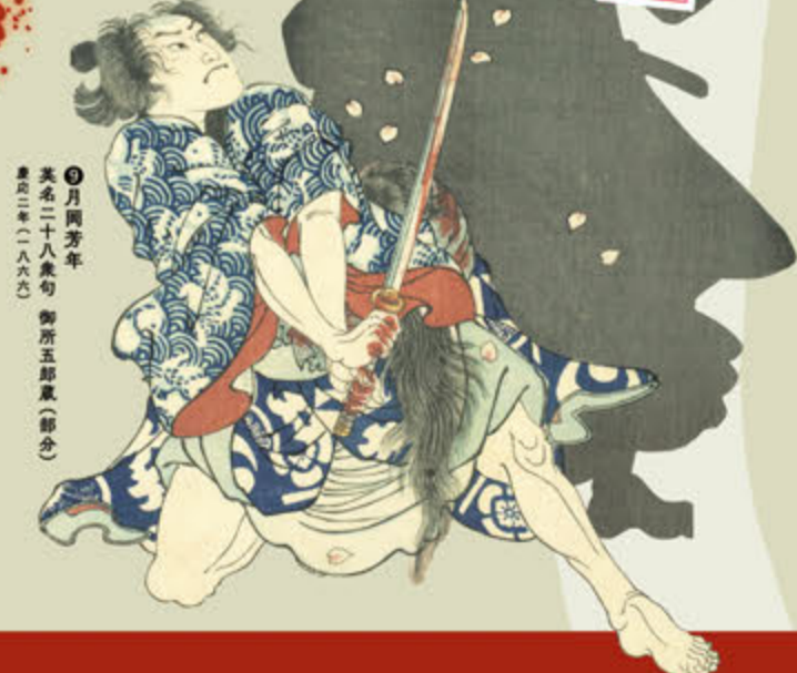
●月岡芳年 英名二十八衆句 御所五郎重(部分) 慶応二年(一八六六)