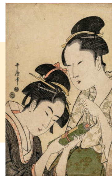
右：喜多川歌麿《お藤とおきた》 大判錦絵 寛政5-6年(1793-94)頃 William Sturgis Bigelow Collection, 11.14282