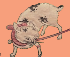
鈴木春信《女三宮と猫》(部分) 中判錦絵 明和4-5年(1767-68)頃 William Sturgis Bigelow Collection, 11.19508

※春信展も一緒に観ると、観覧料が300円割引になります。他の割引とは併用できません。詳細は裏面をご覧ください。