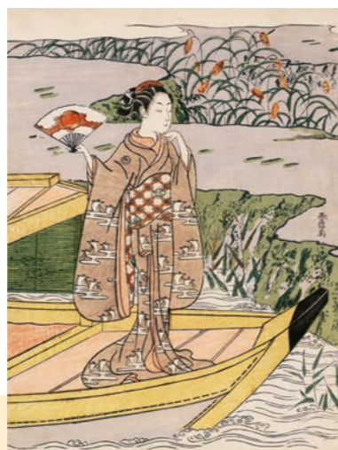
右：鈴木春信《八つ橋の男女(見立八橋)》 中判錦絵 明和4年(1767)頃 William Sturgis Bigelow Collection, 11.19462

春信が登場するまでの浮世絵は多くて2,3色の素朴な色摺版画(紅摺絵)しかありませんでした。そこに春信の多色摺版画(錦絵)が登場し、浮世絵の技術革新が起きたのです。