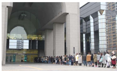
開館前にもかかわらず長蛇の列が！

人気の高まりを見せる「圧切長谷部」展示。平成 30 年 1 月の公開では、1 か月弱で 17,000 人以上が来訪されました。そのうち、65%が県外の方、90%が 20 代・30 代の女性です。