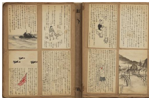
戦地から兵士が妻に送った軍事郵便