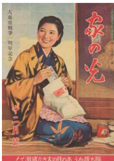
雑誌表紙(慰問袋を作る女性)