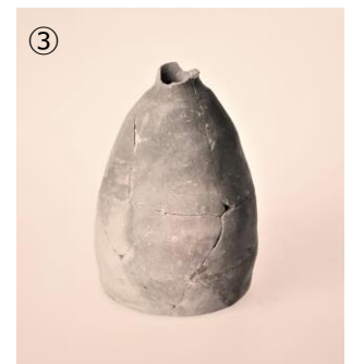
③ 朝鮮半島系土器 (液体運搬具?)

遺跡で最も多く出土するのが土器。遺跡の年代を推定する基準にもなる重要な遺物です。「でも、土器なんか見て何が楽しいの?」そんな声にお応えして、土器鑑賞がちょっと楽しくなる「どきどきポイント」を紹介します。