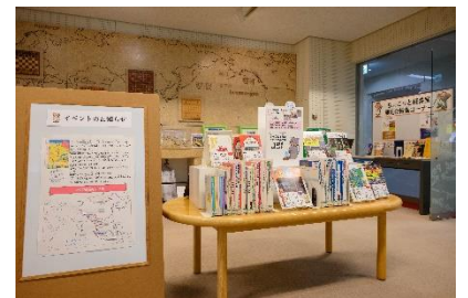
過去の本の紹介の様子