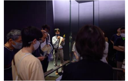
過去のギャラリートークの様子