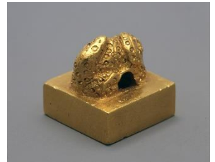
国宝 金印「漢委奴国王」