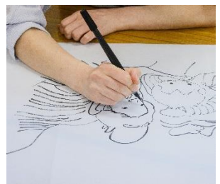
灯籠制作体験の様子