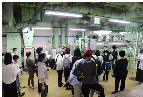
バックヤードツアー