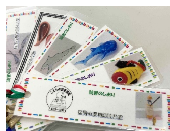
参加者へプレゼントする特製しおり