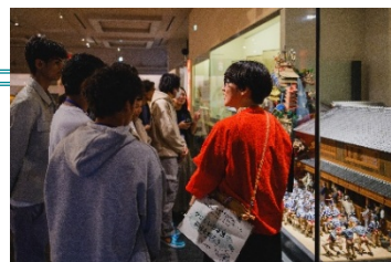
やさしい日本語で 福岡を知ろう