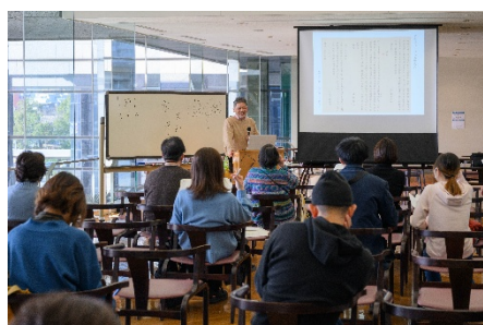
総館長の歴史講座