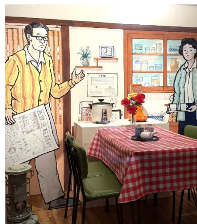
(参考)常設展示室「高度経済成長の時代」の団地での暮らしを紹介するコーナー