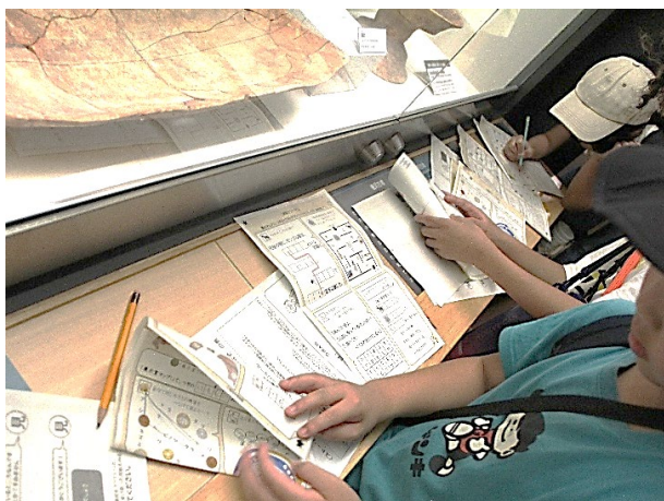
R6 年度の謎解きイベントの様子(内容は異なります)