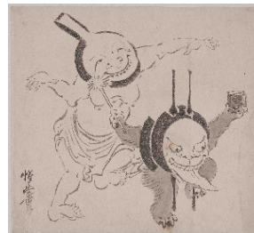
河鍋暁斎「付喪神図」