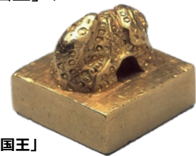
国宝 金印「漢委奴国王」