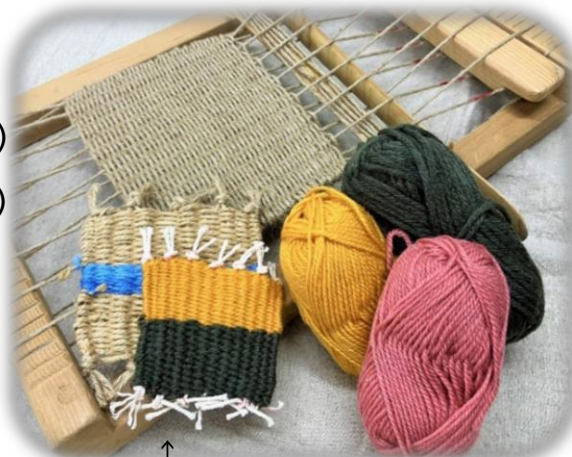
↑ はたお どうく さくひん 機織りの道具と作品のイメージ