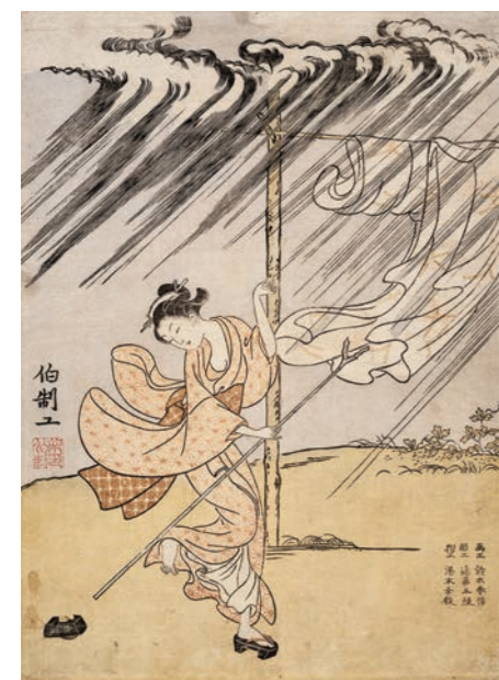
左：鈴木春信《夕立》 中判摺物 明和2年(1765) 絵暦 William Sturgis Bigelow Collection, 11.19430

このたび、アメリカ・ボストン美術館で大切に守られてきたコレクションが、約130年ぶりに里帰りします。奇跡的に当時のままの色彩をとどめた、珠玉の150点で春信とその時代をご紹介します。本物と出会える最高の機会をぜひお楽しみください。