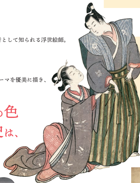
左：鈴木春信《外出の支度》(部分) 中判錦絵 もと明和2年(1765) 絵暦 William Sturgis Bigelow Collection, 11.19447

春信が描く江戸の恋人たちの魅力はなんといってもその計算しつくされた繊細な描写にあります。二人の視線、しぐさ、距離、この瞬間しかないという場面を春信は描き出し、先輩絵師たちが手がけてきた若い恋人というテーマを洗練させていきました。