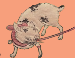
鈴木春信《女三宮と猫》(部分) 中判錦絵 明和4-5年(1767-68)頃 William Sturgis Bigelow Collection, 11.19508

※春信展も一緒に観ると、観覧料が300円割引になります。他の割引とは併用できません。詳細は裏面をご覧ください。