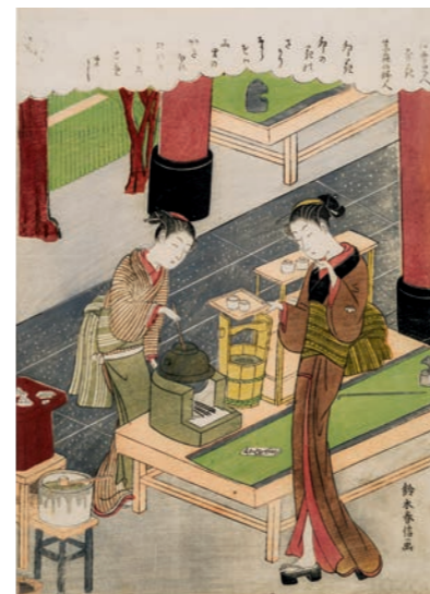
下：鈴木春信《浮世美人寄花 笠森の婦人 卯花》 中判錦絵 明和6年(1769)頃 William Sturgis Bigelow Collection, 11.19515