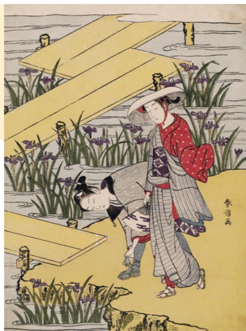
右：鈴木春信《八つ橋の男女(見立八橋)》 中判錦絵 明和4年(1767)頃 William Sturgis Bigelow Collection, 11.19462

鈴木春信(1725?-1770)は、錦絵創始期の第一人者として知られる浮世絵師。