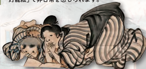
大燈籠絵(母子図)(部分) / 唐人町中年会蔵

「大燈籠絵」は、福岡市内で60点あまり確認されています。定番の武者絵のほか、説話の一場面からほんわか母子図まで、バリエーション豊かな「大燈籠絵」で非日常を感じられます。