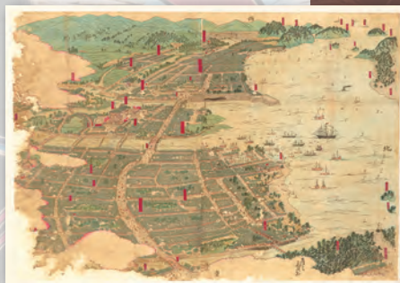
福岡博多鳥瞰図 一得斎高濂作