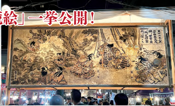
県指定有形民俗文化財「大浜流灌頂大燈籠」(令和5年(2023)8月24日撮影)