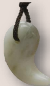
←仕上りのイメージ