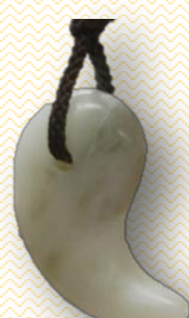
←仕上がりのイメージ