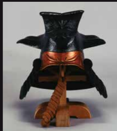
黒漆叩塗帽子形兜 江戸時代(福岡市博物館蔵)