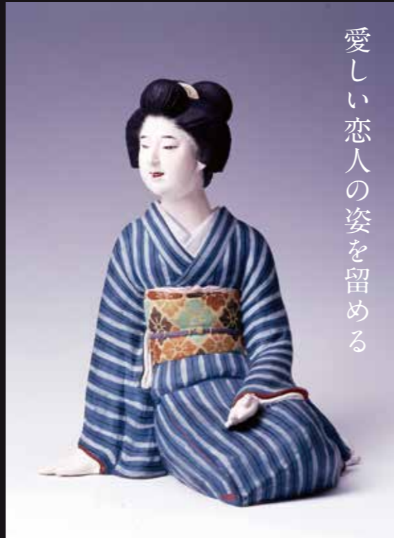
博多人形「初裕」 大正3年(1914)(福岡市博物館蔵)