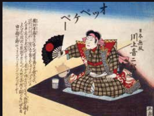
錦絵「中村座大当書生演劇」(部分) 明治24年(1891)7月1日発行(福岡市博物館蔵)