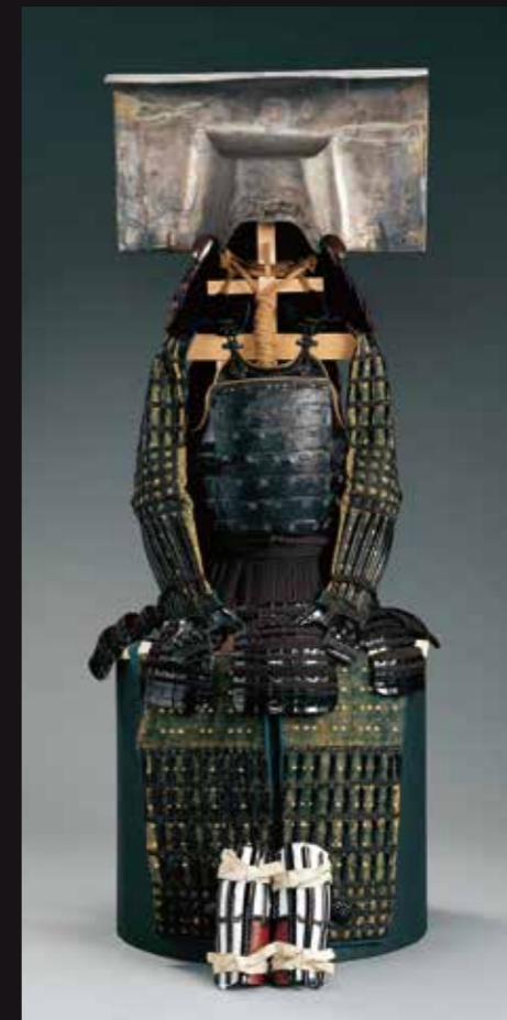
重要文化財 銀箔押一の谷形兜・黒糸威五枚胴具足 桃山時代(福岡市博物館蔵)