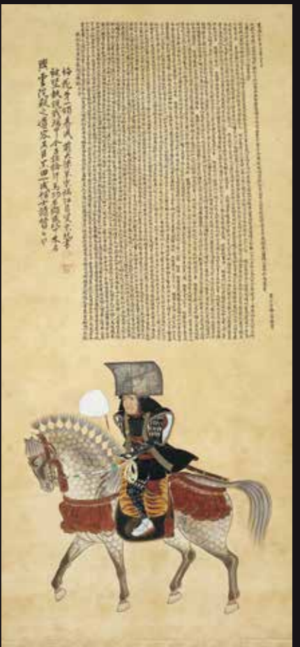
重要文化財 黒田長政像 寛永元年(1624)(福岡市博物館蔵)